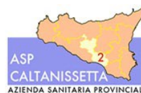
ASP n° 2